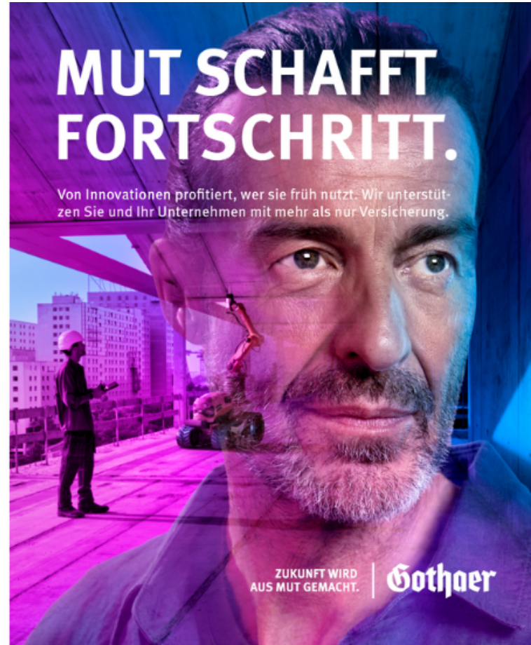
Zwei Motive aus der neuen Markenkampagne der Gothaer